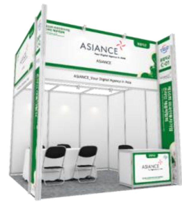
전년도 부스 디자인