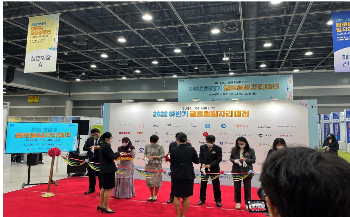
2022 하반기 글로벌일자리 박람회