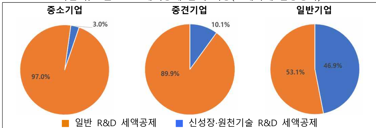
< 기업 규모별 R&D 세액공제 금액 비중(조세특례 심층평가) >